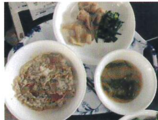
2018 年 3 月 15 日の炊出しメニュー 親子丼、ちくわと大根の煮物、 ほうれん草炒め、みそ汁